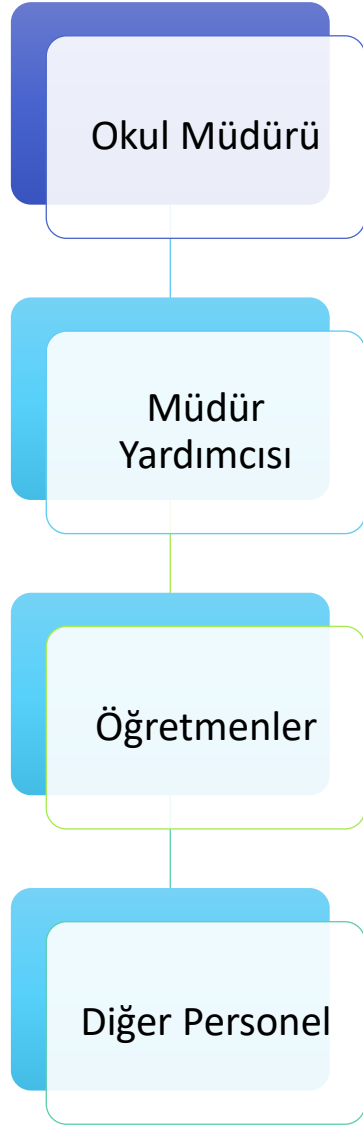
Grafik 2: Yassihöyük Ortaokulu Teşkilat Şeması